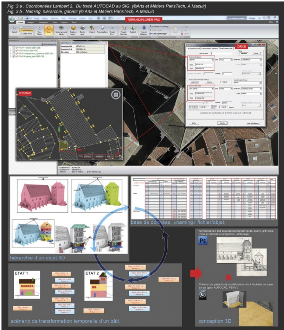
Fig. 3 – a. Coordonnées Lambert 2. Du tracé AutoCAD au SIG (Arts et Métiers ParisTech, A. Mazuir); b. Naming, hiérarchie, gabarit (Arts et Métiers ParisTech, A. Mazuir).

qui sont mises aux proportions dans le logiciel Photoshop. Dans 3ds Max le tracé de la zone de travail est dupliqué et ramené en coordonnées 0-0-0 pour corriger les problèmes de précision dans les manipulations, ou opérations d'édition des objets. À l'aide de prises de mesures sur site, complétées par des